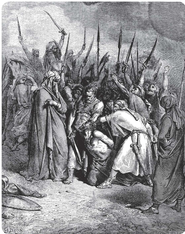
Samuel rozkazuje zabić Agaga

Dla ułatwienia korzystania z przykładów ułożyłem je tematycznie. Opracowując tematyczny spis treści, zastosowałem pewne uproszczenia, gdyż niektóre przykłady mają wymowę wielotematyczną.